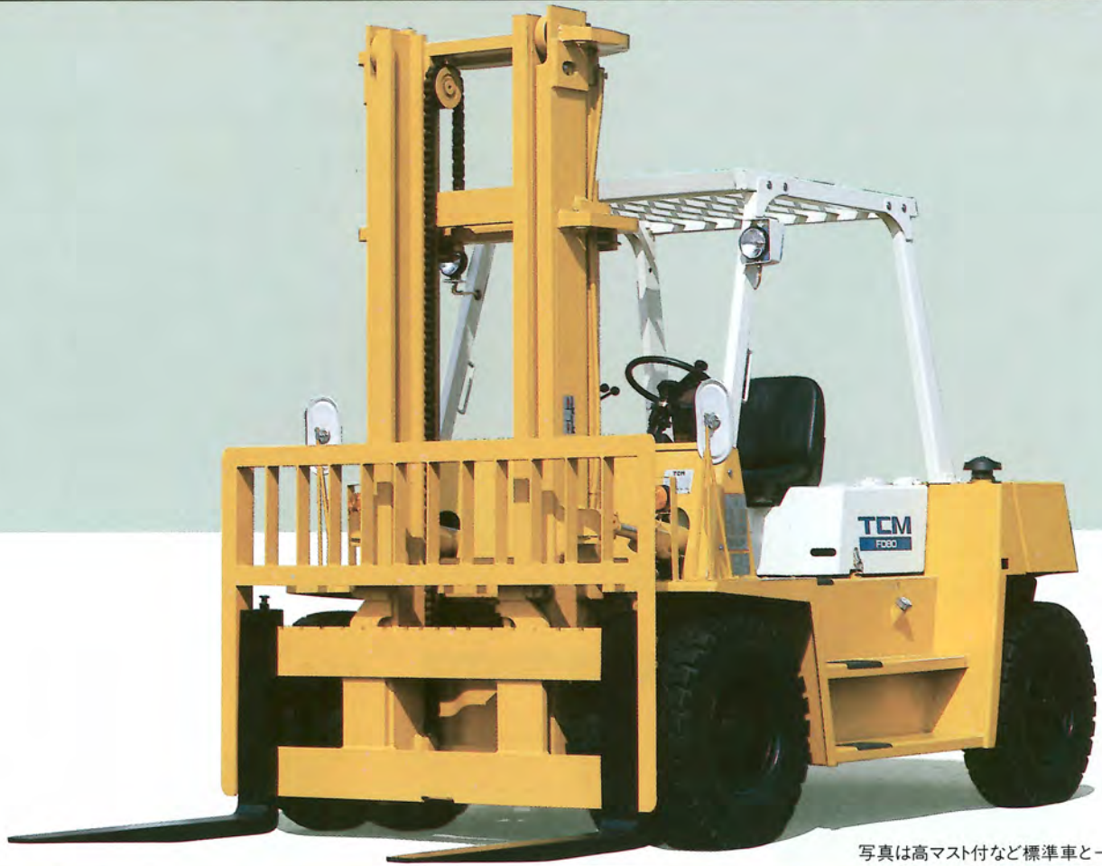
写真は高マスト付など標準車と一部異なります。