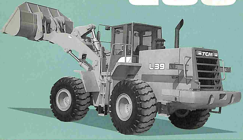
※写真の車両はオプション装備車です。(ワンタッチカブラ、ハイリフトアーム、など)