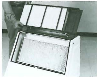
吸塵システムは、バキュームによって行ない特殊フィルターによって粉塵を濾過します。埃りのひどい時はセカンダリーフィルターをご使用になると効果的です。