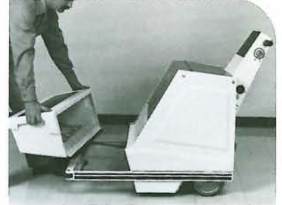
ホッパーは56ℓの大型容量です。ゴミは、ホッパーを機体から取外して廃棄してください。