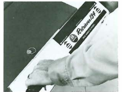
作業速度は、前進2速、後進1速でグリッパハンドルで操作します。