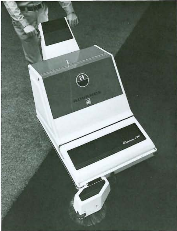
12V92AHのバッテリー2個搭載、サイドブラシによって壁際のごみを掃き出します。