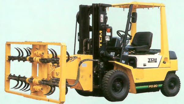
●写真は縦つかみタイプ

牧草ベール・原綿・古紙などの 荷上げ、荷下ろしがスピーディ。 労力の軽減、運搬コストの 低減を実現！