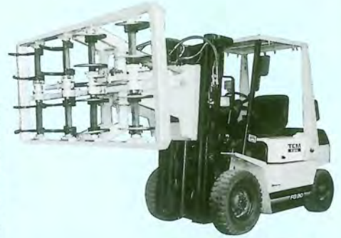
●写真は横つかみタイプ