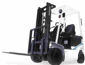
カウンターバランス型 フォークリフト AGRES BX