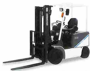
カウンターバランス型 フォークリフト FB-VIII

※自動補水装置「補水くん」はオプション装備です。 ※仕様、装備の組合せ等により、当オプションを装着できない場合があります。詳しくは当社スタッフまでお気軽にお問い合わせください。