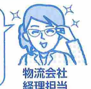
物流会社 経理担当

圧倒的な作業時間の短縮を補水くんが実現してくれたので、大幅な経費削減につながっています。さらに希硫酸を扱う機会が減るので、現場の安全面でもうれしいですね。