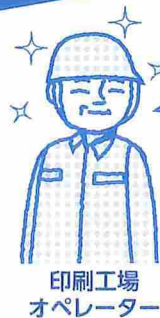
印刷工場 オペレーター

複数のバッテリー車を使用している当社では、補水作業に結構な労力がかかっていました。補水くんは驚くほど作業が楽で、面倒だと感じるヒマすらなくなりましたね。もう今までの補水作業には戻れません!