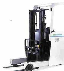
リーチ型 フォークリフト AGRES RX

★このカタログの内容は平成 27 年 10 月現在のものです。なお改良のため予告なく仕様変更することもあります。 ●ボディカラーは印刷の都合により、実際の色と多少異なって見えることがあります。