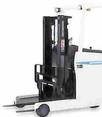
リーチ型 フォークリフト FRB-8A