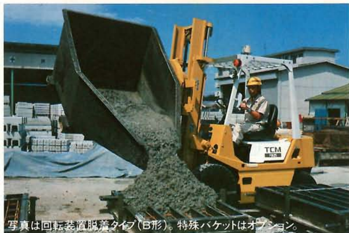
写真は回転装置装着タイプ(B形)。特殊バケットはオプション。