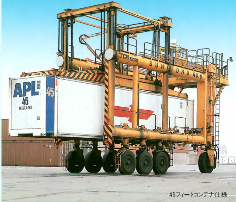
45フィートコンテナ仕様