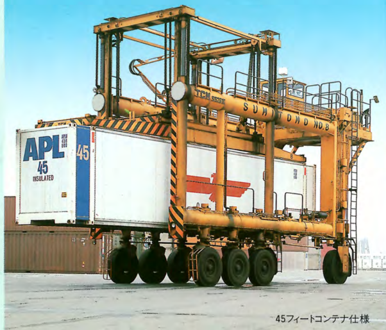
45フィートコンテナ仕様